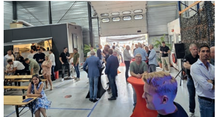
Gezellige drukte tijdens het BAKA Glasevent.

efficiënt platform om je producten te beheren, of een glasbedrijf dat op zoek is naar een eenvoudige en snelle manier om bestellingen te plaatsen en te volgen, ons Leveranciers Portaal is er om je te helpen.'